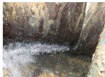
漏水箇所（継ぎ手部）