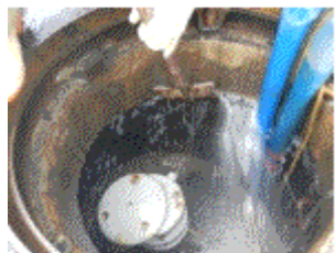
森山支線（新池町地内） 電食による鋼管600mm漏水補修