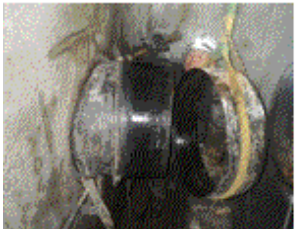
坂祝用水路（加茂野町地内） 制水弁600mm取替補修