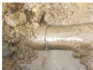
中山分線（八百津町地内） VM管350mm継手部の漏水補修