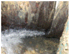
米田畑第2支線（下米田町地内） VP管250mm継手部の漏水補修