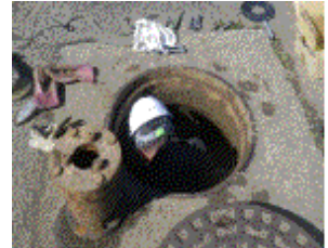
中山分線（八百津町地内） 空気弁75mm取替補修