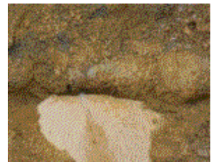
黒岩分線（加茂野町地内） VP管200mm継手部及び制水弁補修