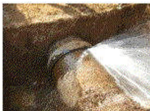
ジョイントから漏水