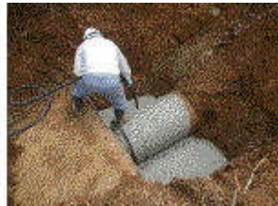
防護コンクリート打設