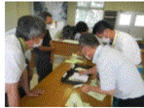
書面表決書の開封