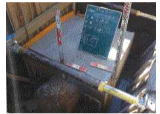
羽生用水路（蜂屋町地内） 空気弁75mm取替補修