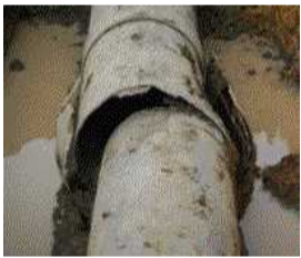
坂祝支線（坂祝町地内） FRPM管900mm継手漏水補修

連合で管理する農業用水施設において、下記のとおり緊急漏水等補修工事を6件行いました。