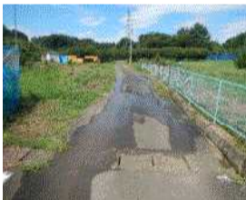
佐口支線（山之上町地内） VU管350mm漏水補修