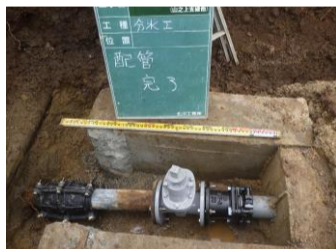
山之上支線（山之上町地内他）