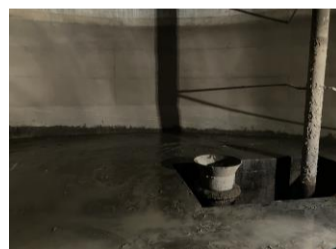
山之上配水槽（山之上町地内）