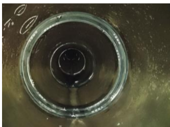
羽生用水路（蜂屋町地内）