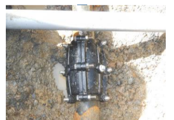
本地支線（山之上町地内）