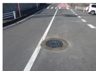
人孔蓋修繕（山之上町地内他）