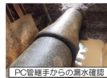
PC管継手からの漏水確認