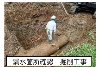
漏水箇所確認 掘削工事