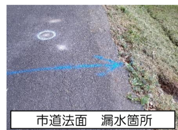
市道法面 漏水箇所

8月上旬に美濃加茂市下蜂屋地内の羽生用水路で漏水事故(PC管Φ600)が発生しました。農業用水の需要量が多い時期でもあったことから、関係機関で協議し、漏水量などの状況変化を観察しながら、利水者の皆様への影響を極力抑えられる時期に行うこととし、9月19日から補修工事に着手し、9月までに工事が完了しました。関係者の皆様のご理解ご協力に対し心からお礼申し上げます。