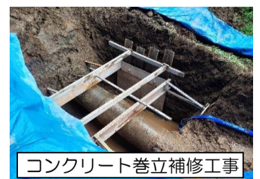
コンクリート巻立補修工事

今年度の「農業用水情報」は、今月号をもって休刊とさせていただきます。 次号は、令和6年4月から発刊させていただきますので、よろしくお願いいたします。